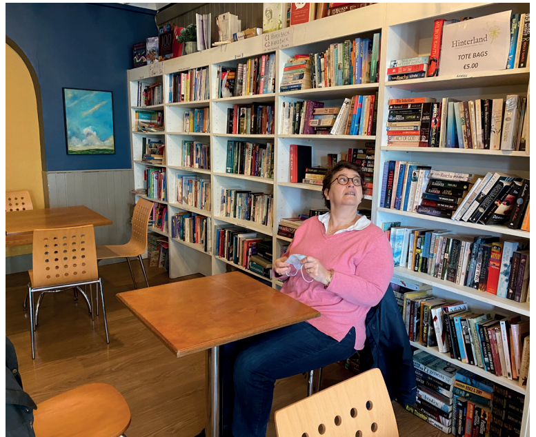
Het aanbod van boeken in 'the bookmarket'

Je verhuis betekent uiteraard afscheid van onze bib. Hoe voelt dat?