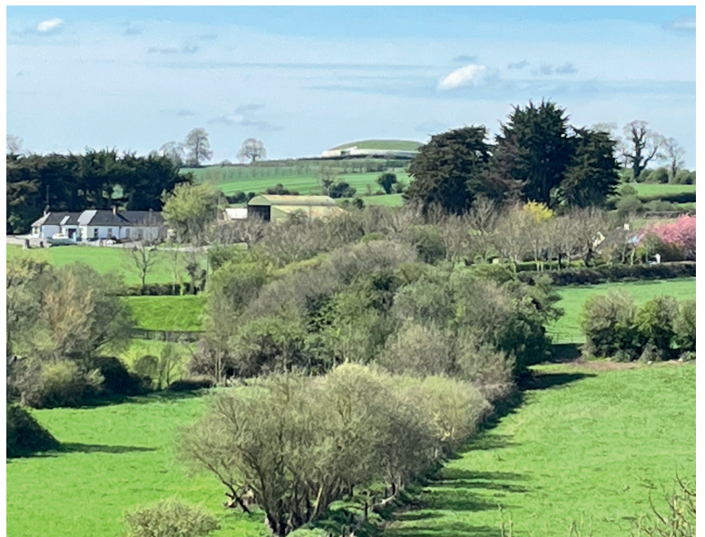
Uitzicht op Newgrange (grootste prehistorische graftombe)