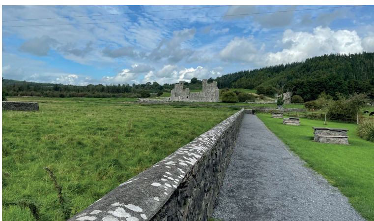
Restanten van Fore Abey (County Westmeath)