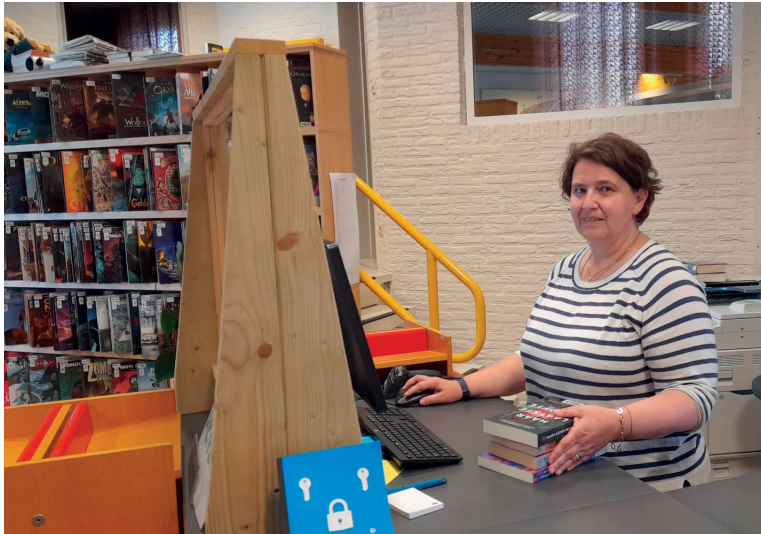
Het aanbod van boeken in 'the bookmarket'